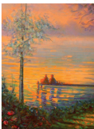
Expo de peintures