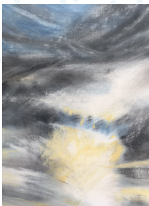
Expo de peintures